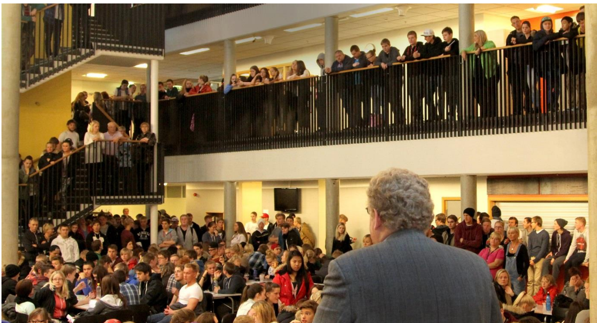
Frá skólaásetningu í ágúst 2013.