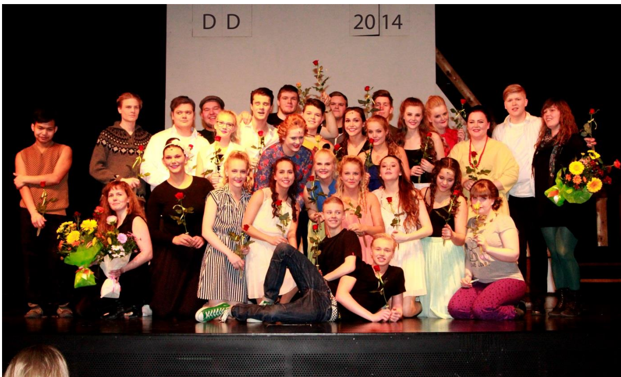
Hópurinn sem tók þátt í söngleiknum Dirty Dancing.

Verkfall kennara hafði töluverð áhrif á skólastarfið á vorönn. Verkfallið stóð í þrjár vikur en samkvæmt samkomulagi var fimm kennsludögum bætt við önnina og því féll kennsla niður í tíu daga. Hér var kennt á þriðjudag eftir páska og á sumardaginn fyrsta en auk þess var þremur kennsludögum bætt við í byrjun maí. Prófadögum var fækkað en þó tókst að ljúka önninni á réttum tíma. Það er mat stjórnenda að með sameiginlegu átaki hafi tekist að ljúka önninni eins vel og hægt var.