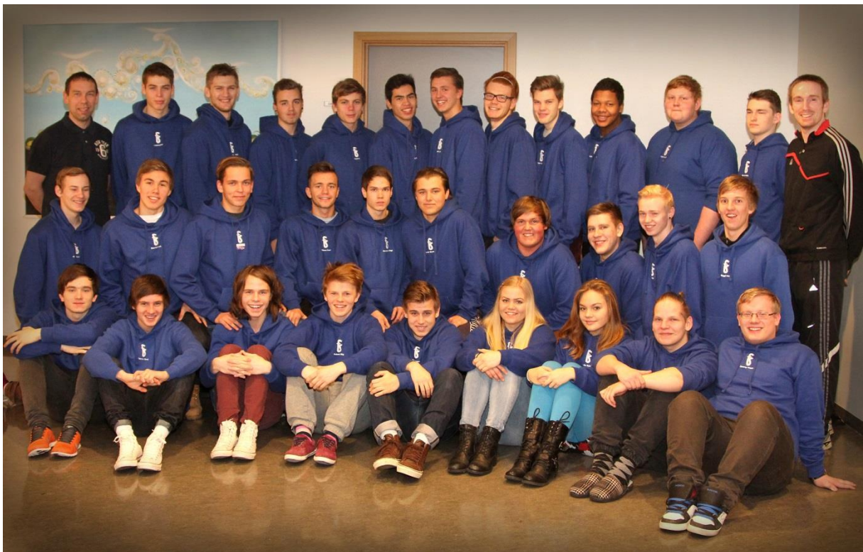
Nemendur á afreksíþróttabraut haustið 2013.

Í lok nóvember fóru sex nemendur og fjórir kennarar af starfsbraut til Finnlands að skoða starfsnámsskóla. Ferðin tók tvær vikur og var styrkt af Leonardo da Vinci- sjóðnum.