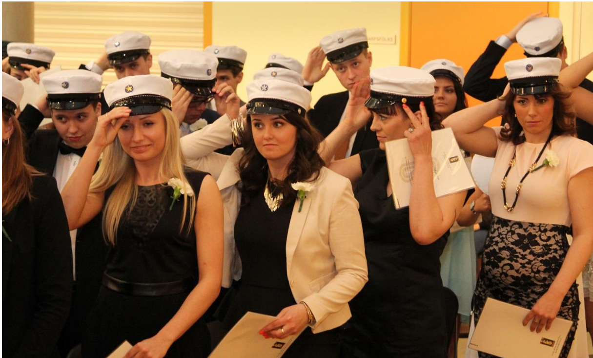
Frá útskrift vorannar 2014.